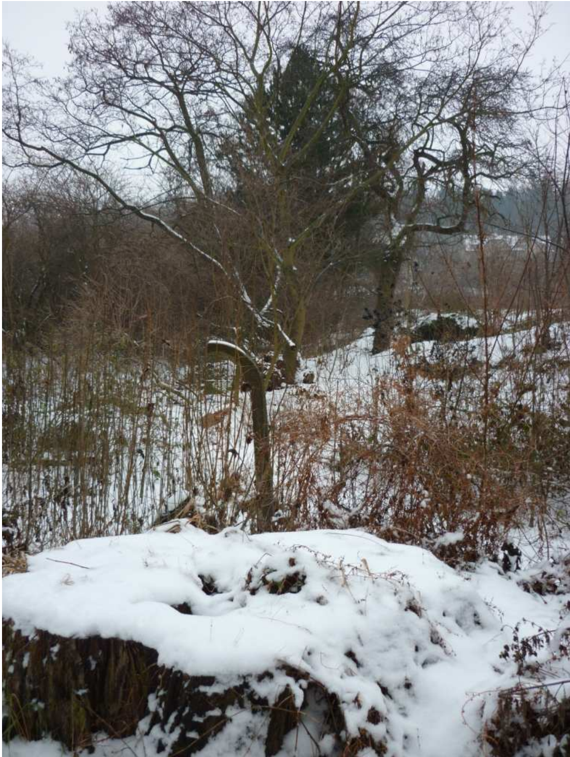
Nedotčený stav po proudu potoka v oblasti pokácených vrb 15.12