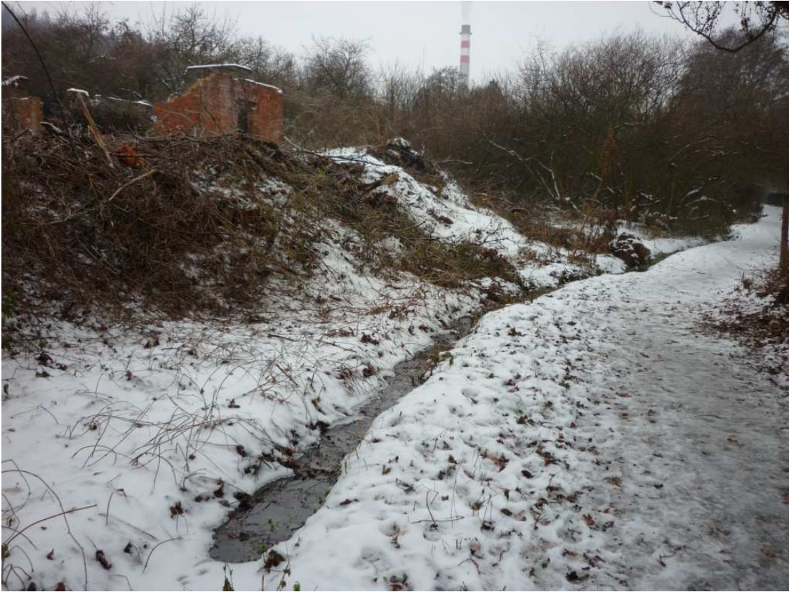
Celkový pohled od ul. Na Rozdřílu.