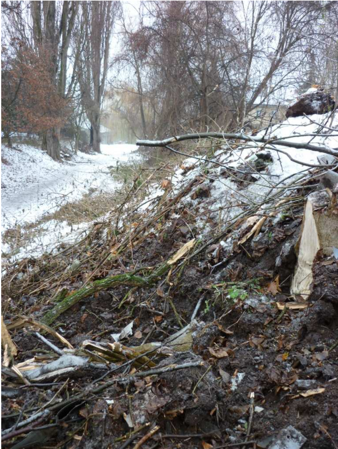
Totéž místo při pohledu shora.