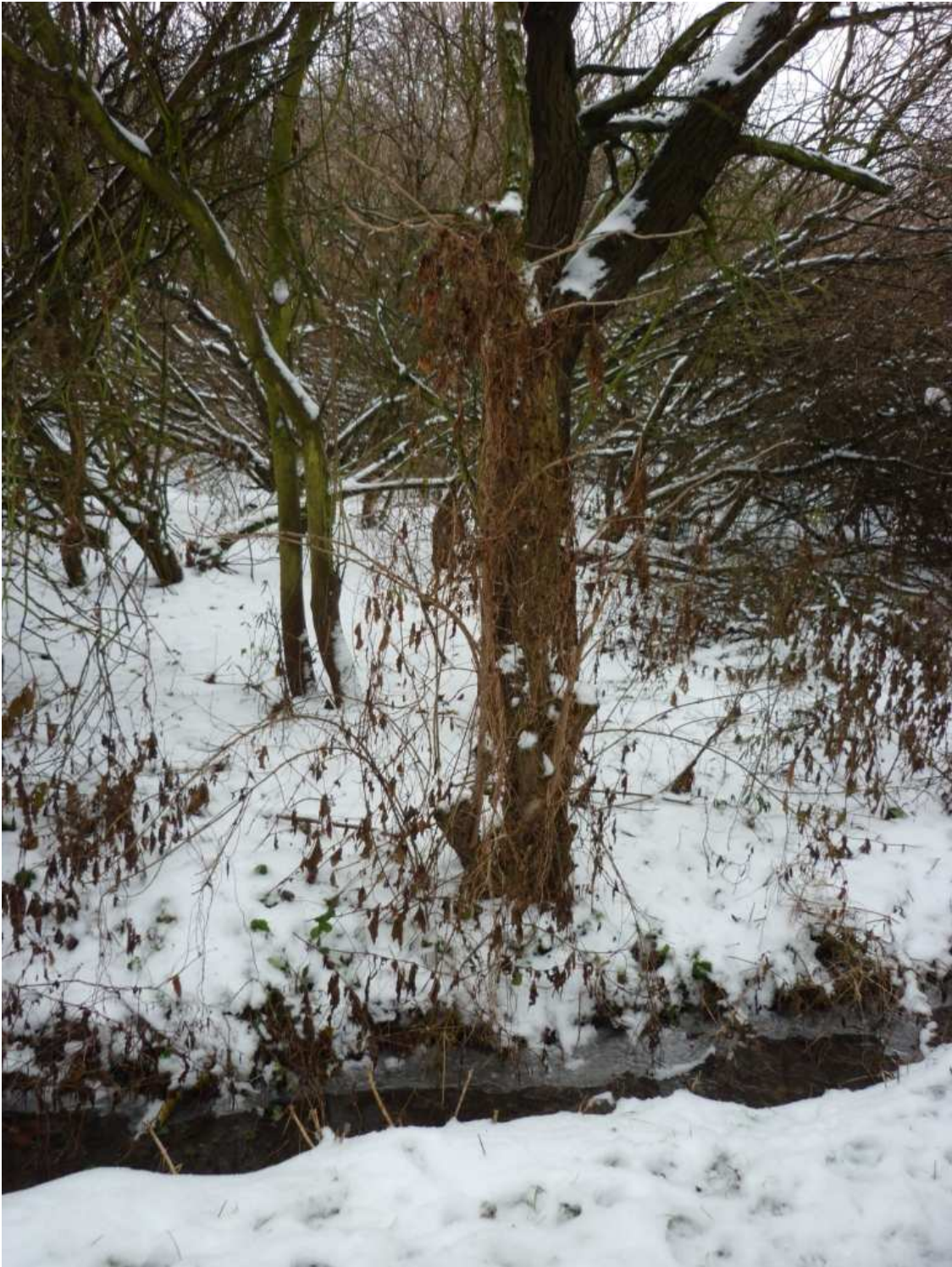
Dále po proudu směrem k ul. Na Rozdílu