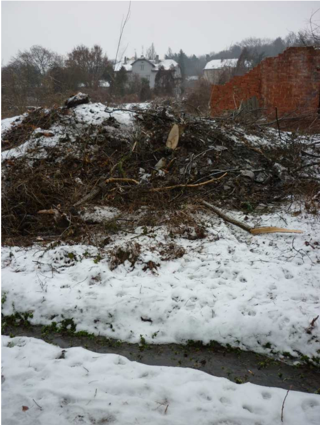
Vyřezání dřevin zřejmě již v ochranném pásmu potoka a nesporně v území s funkčním využitím ZMK.