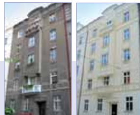
PŘED REKONSTRUKCÍ / PO REKONSTRUKCI