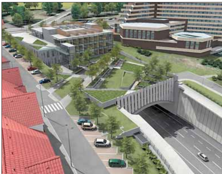
Multifunkční středisko by mělo stát nad portálem Strahovského tunelu.