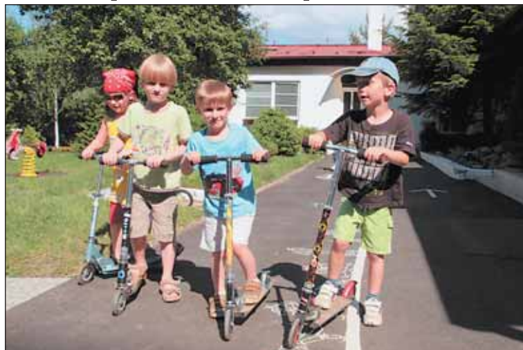
Ve školkách bude od září dovádět víc dětí než letos.

Z výsledků zápisů do mateřských škol vyplývá, že kromě všech předškoláků, které jsou ředitelé školek povinni přijmout dle školského zákona, bylo nepřijatých dětí starších tří let v celé Praze 6 pouze 27. „Tyto děti budou umístěny v rámci dodatečného zápisu na konci prázdnin,“ ujišťuje Balatka. Nová místa vzniknou v MŠ Na Okraji přebudováním školnického