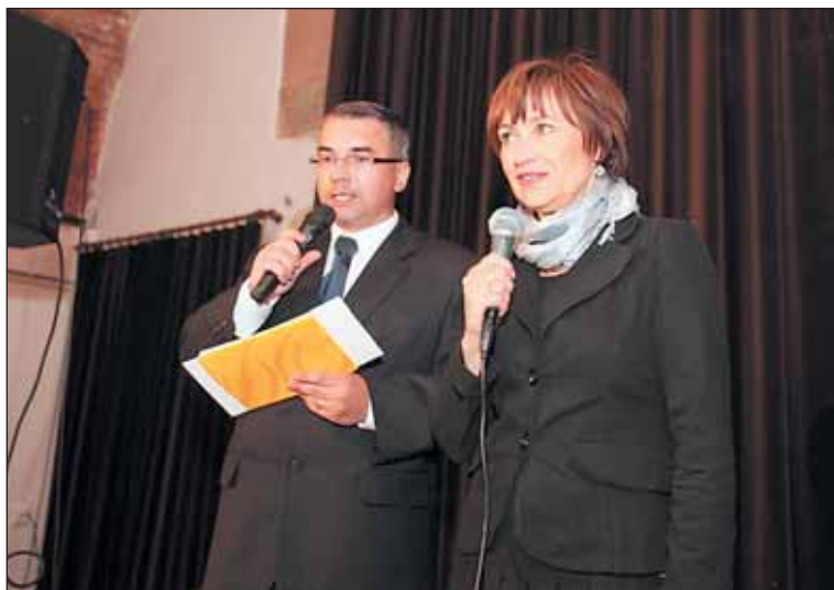
Během večera věnovaném dárcům Domova vystoupila Petra Černocká.

Dárci, kteří jsou ochotni přispět na vybavení domova (nábytek pro klienty, židle do jídelny, gastro provoz), mohou tak učinit na darovací účet Domova: 10006-242242061/0100. „Za každý dar jsme vděční,“ říká Biňovec.