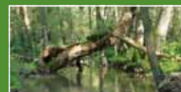
Procházky 1200 m od domu