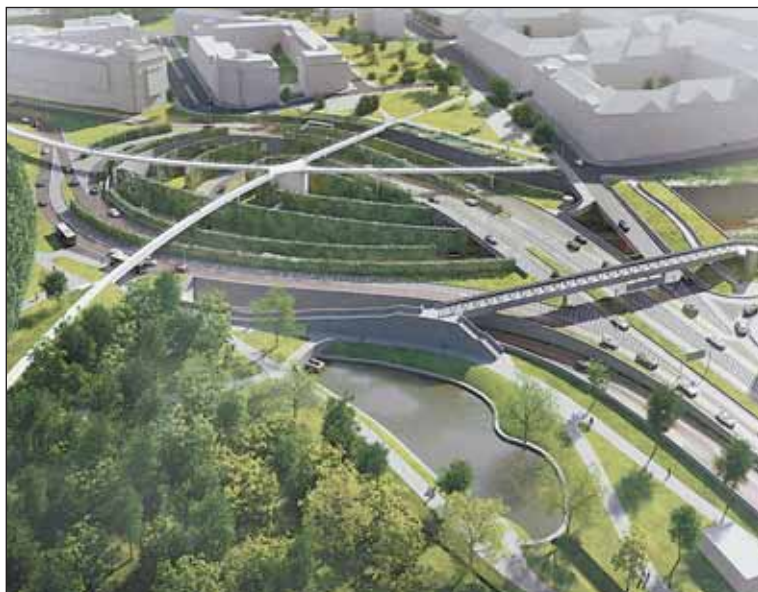
Více o projektu Zelená Malovanka na webu www.malovanka.eu .

Pražští radní v květnu souhlasili s ukončením prací na doposud připravovaném územním plánu, který se chystal od roku 2007. Současně schválili zahájení prací na novém Metropolitním plánu. Během let se ukázaly slabiny dosavadního přístupu k územnímu plánování. Metropolitní plán by měl být jednodušší, přehledný a pouze určit jednoduché základní funkční využití území města vymezením zastavěného a nezastavěného, zastavitelného a nezastavitelného území. Návrh ještě musí schválit zastupitelé.