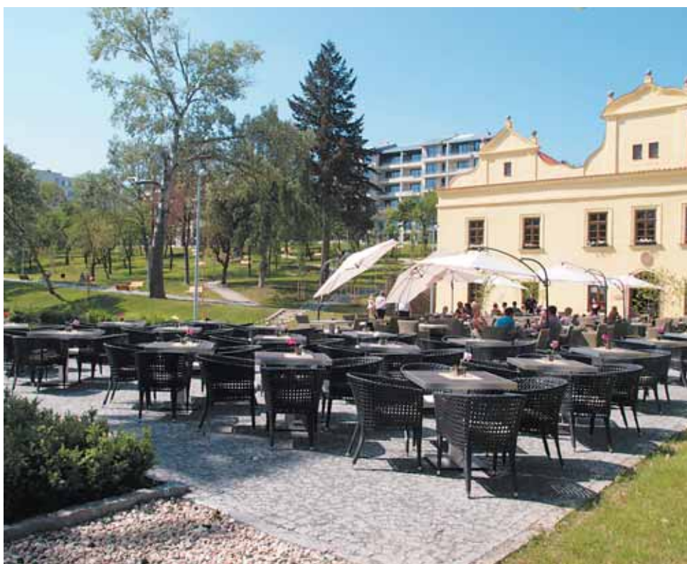
Veřejnosti se na konci května otevřel park na Kajetánce. Opraven je i historický zámek.