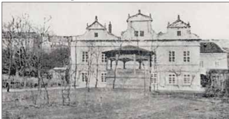
Kolem roku 1920 sloužil zámeček jako hostinec.