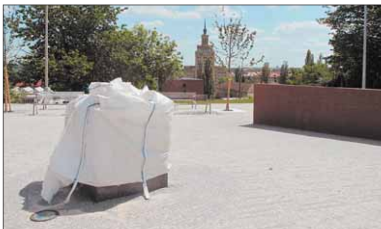
Místo, kde bude stát socha slavného fotbalisty, upravila městská část do podoby parčíku s lavičkami a stromy. Socha bude slavnostně osvětlena.

Bronzová socha v podobě běžícího fotbalisty žonglujícího s míčem, v mírně nadživotní velikosti, má výšku 2,3 m. Bude umístěna na žulovém podstavci v ulici Na Julisce. Podstavec a hlavní socha budou natočeny hlavní osou tváří směrem ke stadionu, kolem sochy budou v dlažbě zapuštěny otisky nohou dalších úspěšných fotbalistů. Za sochou bude umístěna stěna s plaketami a reliéfem Dukly.