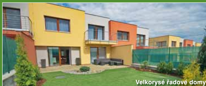
Velkorysé řadové domy