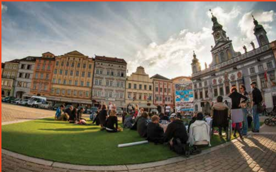
Ilustrace k textu Problém jako příležitost Den architektury: Přednáška o veřejném prostoru na hlavním budějovickém náměstí.

V několika posledních letech lze v české společnosti sledovat určité trendy spojené s budováním lokální identity a zájmem o bezprostřední okolí. Na jedné straně se projevují rozvojem zahrádek a pěstováním vlastních plodin ve městech, rozvojem farmářských trhů a zájmem o lokální potraviny, ale i obecněji o suroviny a materiály a s tím spojenou recyklaci či znovužití, půjčování nebo sdílení věcí; na straně druhé se vyznačují zaměřením na kontext, místo a místní komunitu. Ruku v ruce s těmito trendy dochází i k určité aktivizaci veřejnosti: téměř pětadvacet let od revoluce se konečně učíme účinně se zabývat věcmi veřejnými a (snad) přestáváme být zcela lhostejní ke svému okolí. Zájem o naše bezprostřední okolí snad již nekončí u prahu našeho bytu či domu.