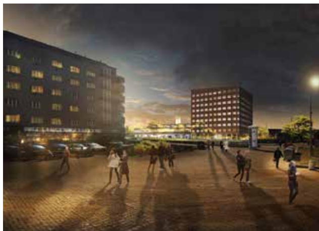
Centrum Palmovka, AP atelier