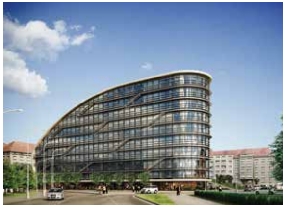
Vizualizace Argentinské hvězdy pro Prahu 7, CMA