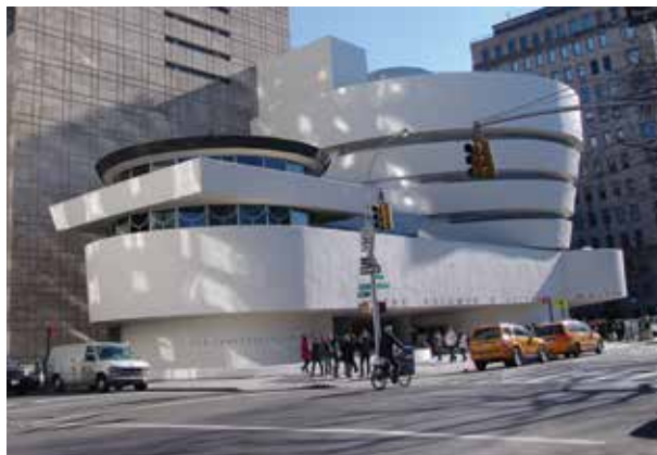
Muzeum Solomona Guggenheima, New York – Manhattan, architekt Frank Lloyd Wright, realizace 1943–1959. Stavba se rodila z hlediska územního plánu i z hlediska stavebně technologického s řadou zdánlivě nepřekonatelných obtíží – podobně jako opera v Sydney. Příběh těchto staveb předznamenal i etapu realizace kulturních objektů v posledních desetiletích: mimořádné architektonické ambice, obtížné naplňování nároků invence na technologie, odložení tradiční tektoniky ve jménu příklonu k organickým formám, propojování tradičních materiálů s novými atd.; zjednodušeně řečeno: výstřední objekty, až experimenty nikoli bez jistých rizik, ale v řadě parametrů vždy prvotřídní architektura. Wright navrhl budovu jako muzeum s kontinuálním prostorem – inverzní spirálou. Objekt přerostl díky nezaměnitelnému exteriéru i interiéru ve společenské centrum. Jde o jednu z nejznámějších architektonických realizací na světě. Intenzivní provoz si vyžádal velkou přístavbu, nicméně příznačná silueta zůstala pietně nenarušena.