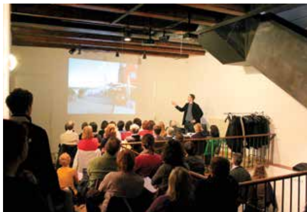
Lidová škola urbanismu 2012, Galerie Jaroslava Fragnera

Občanské sdružení PragueWatch díky grantu Nadace české architektury ve spolupráci s Galeríí Jaroslava Fragnera v Praze letos již druhým rokem organizuje Lidovou školu urbanismu.