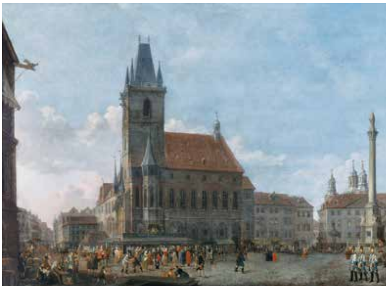
Ludvík Kohl, Pohled na Staroměstské náměstí se sloupem Panny Marie