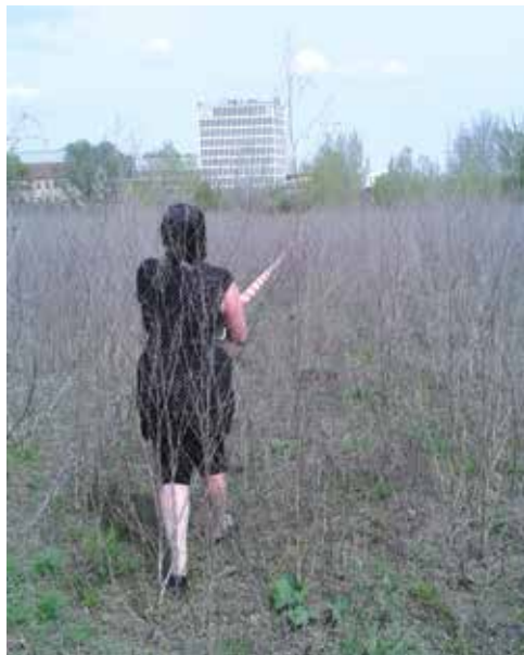
Vyměňování Bulváru Václava Havla, hlavní třídy Jižního centra

Autor je členem občanského sdružení 400/27