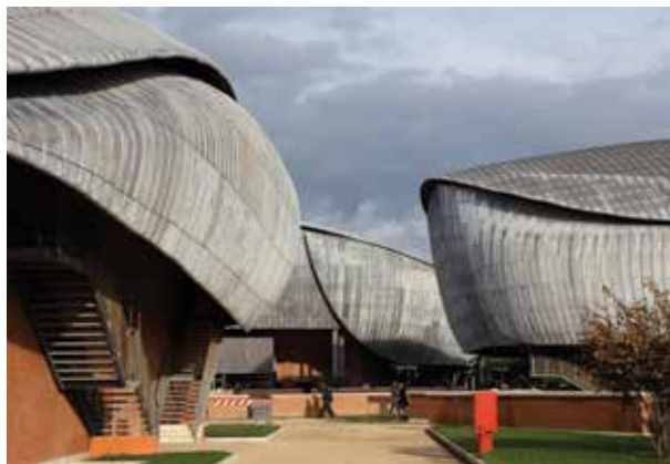
Parco della Musica, Řím, realizováno v letech 1994–2002, architekt Renzo Piano. Mimořádné ambiciózní projekt, italská metropole tím získala architektonicky velkolepý koncertní sál splňující soudobé náročné požadavky na akustiku.

Proč by měla vzniknout a co by mohla nabídnout nová koncertní síň pro Prahu, o níž se začíná hovořit.