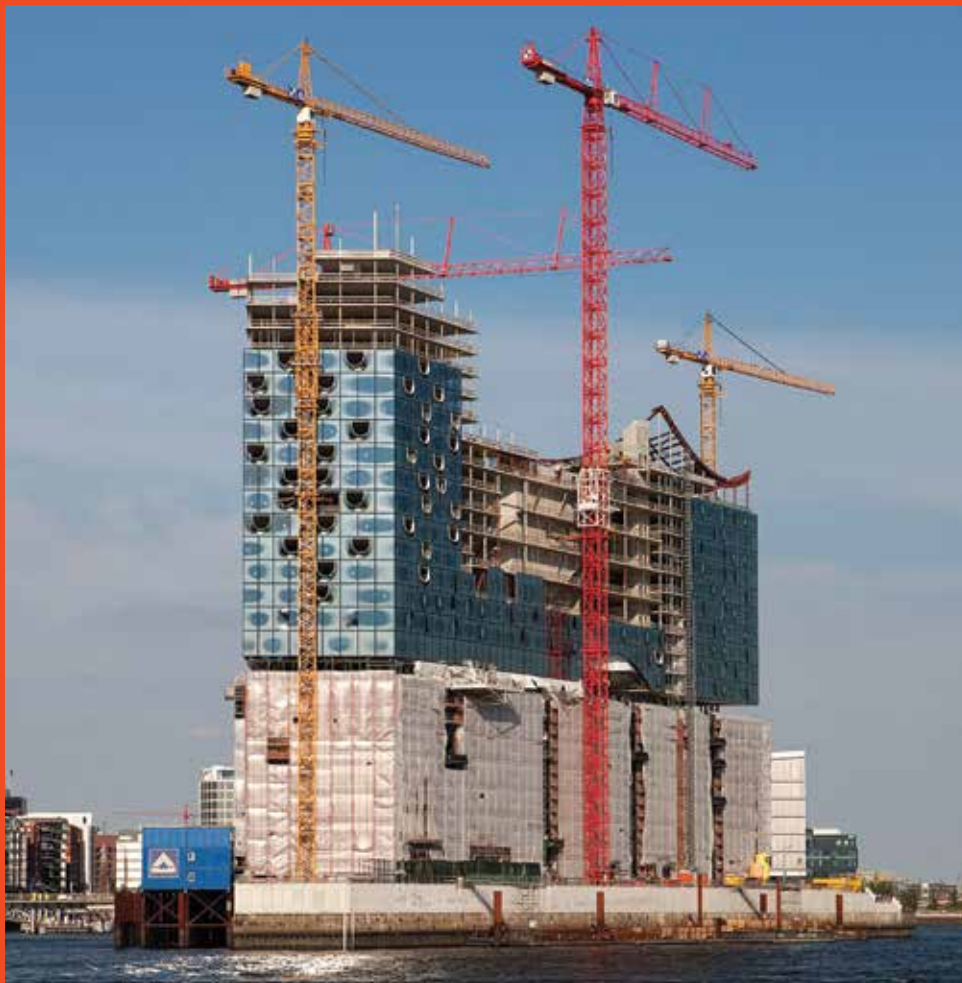
Ilustrace k textu Katedrála pro 21. století

Elbphilharmonie Hamburg, architekti Herzog & deMeuron, soutěž proběhla v roce 2003, stavba celého komplexu pokračuje.