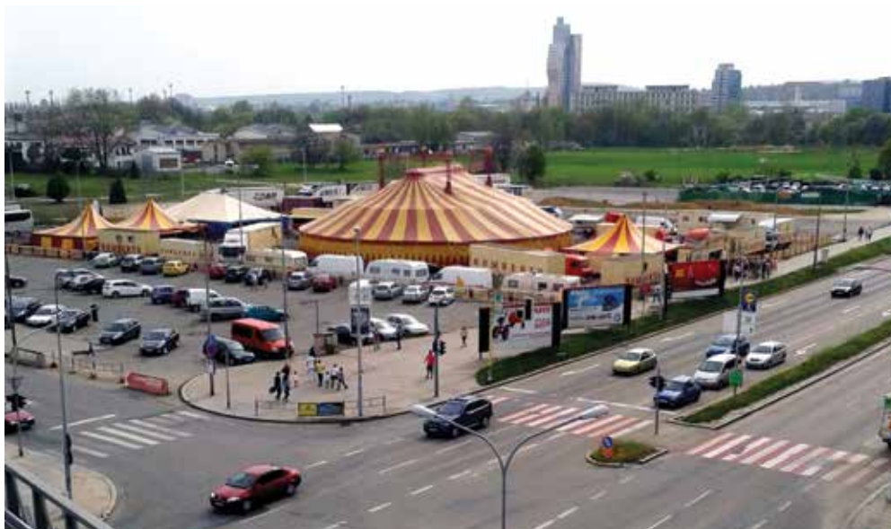
Cirkus Aupark. Nejllepší varianta využití území

ném trhu, už léta kreslí územní plány pro celou oblast Jižního centra. Výchozím dogmatem pro filozofii zamýšlené čtvrti je oblíbené heslo „Občan – hrozba města“. Proto jsou plochy pro bydlení stlačeny, co to jde, a namísto požadavku na minimální obydlenost je stanoven požadavek obydlenosti maximální, aby bylo každému jasné, pro koho tento krněnský District 9 rozhodně určen není! Ústředním urbanistickým motivem Jižního ghetta je honosný Bulvár (jako provokaci ho místní politici navrhuji pojmenovat po Václavu Havlovi) zvíci několika desítek metrů, po němž má jezdit sympatických 20 000 aut denně. Tato dálnice má mít tu čest být lemována špalírem obchodně-administrativních komplexů, které se budou upínat k odsunutému nádraží, jež Brno už sto let staví.